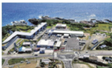
防災道の駅指定候補の道の駅「すさみ」

国土交通省は「道の駅」に防災や生活拠点の機能を加える「第3ステージ」の取り組みを加速する。都道府県ごとに1～2カ所を「防災道の駅」に指定し、広域的な災害対応機能を整備。地域防災計画で避難所に指定される約500駅は、2025年度までにBCP（事業継続計画）を策定する。制度や施策の具体化に向け、月内にも検討業務の委託先を決める公募型プロポーザルを公告する予定だ。